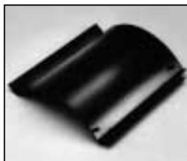
L4.83177.E Internal side baffle left Mantelstromblech links