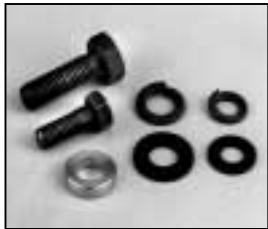
L4.83166.E Stirrup mounting set p.o. Bügelbefestigungs Set p.o.