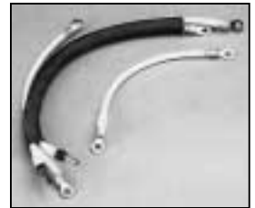
L4.83058.E Internal cable set 200-240 V p.o. Kabel-Set innen 200-240 V p.o.