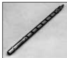
L4.83083.E Focus spindle p.o. Fokusspindel p.o.