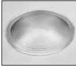
L4.83090.E Fresnel lens Stufenlinse