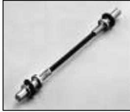
L4.83084.E Flexible shaft Flex-Welle