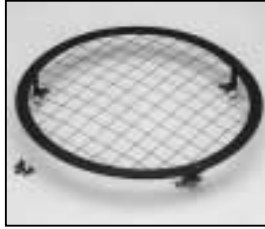
L4.83077.E Wire guard complete Schutzgitter komplett