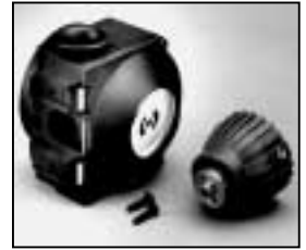
L4.83026.E Housing for rotary switch p.o. Gehäuse für Drehschalter p.o.