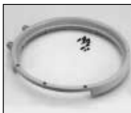
L4.83089.E Front casting Frontteil