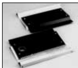
L4.83076.E Internal side baffles left + right Mantelstrombleche links + rechts