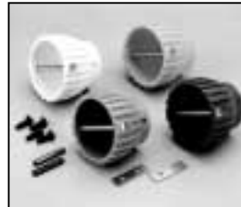
L4.83034.E Focus knob set p.o. (white, blue, yellow, red) Fokusknopf-Set p.o. (weiß, blau, gelb, rot)