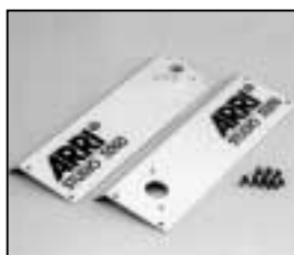
L4.83082.E Side panels left + right p.o. Seitenbleche links + rechts p.o.