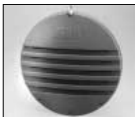
L4.83071.E Rear casting Rückteil