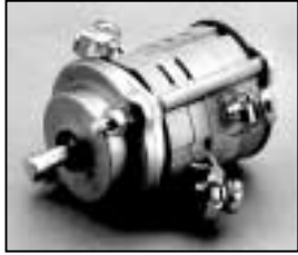
L4.83027.E Rotary switch p.o. Drehschalter p.o.