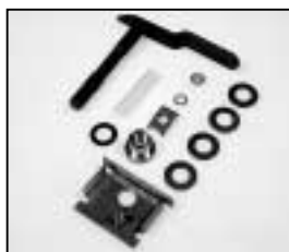
L4.80125.E Lamp lock shaft Hebel geschweißt