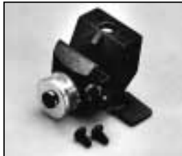
L4.83024.E Accessory bracket with safety catch p.o. Halteklaupe mit Sicherungshaken p.o.