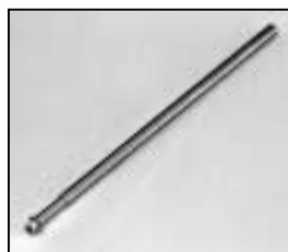
L4.83078.E Guide rail Leitspindel