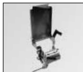
L4.83074.E Lamp holder + lamp carriage Lampenfassung + Fokusschlitten