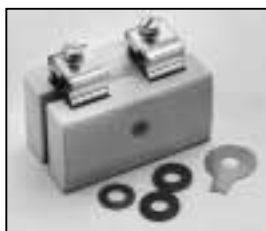
L4.83008.E Lamp holder complete Lampenfassung komplett