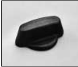
L4.81380.E Focus knob Fokusknopf