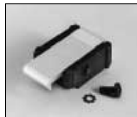
L4.79747.E Door catch set Schnapphaken Set