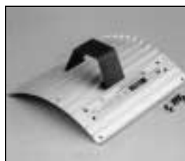
L4.83174.E Side extrusion compl./right Rippenblech kpl./rechts