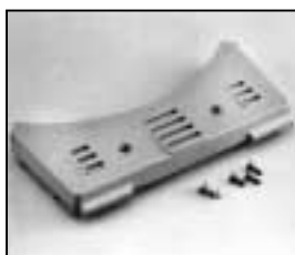
L4.83072.E Base casting front and rear Wannenstirnteil