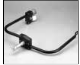
L4.83085.E Stirrup p.o. Haltebügel p.o.