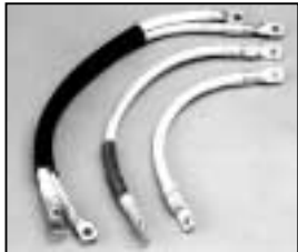
L4.83059.E Internal cable set 100-120 V p.o. Kabel-Set innen 100-120 V p.o.