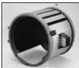
L4.83070.E Housing compl. Gehäuse kpl.

NOTE: WHEN ORDERING QUOTE PART NUMBER BEMERKUNG: BEI BESTELLUNG IDENT.-NR. ANGEBEN