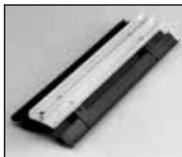
L4.83088.E Top cover Abdeckung oben