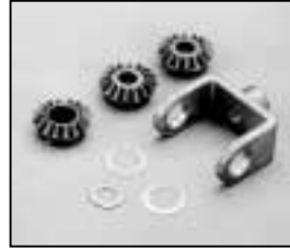
L4.83033.E Focus gear set Zahnrad Set