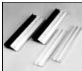
L4.83087.E Extrusions, top Rippenbleche oben