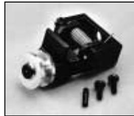
L4.83025.E Top latch assembled p.o. Torsicherung montiert p.o.