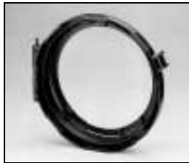
L4.83073.E Lens door 45° Linsenfassung 45°