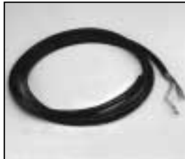
L4.83155.E Mains cable 200-240 V p.o. Netzkabel 200-240 V p.o.