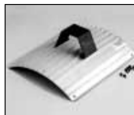
L4.83175.E Side extrusion compl./left Rippenblech kpl./links