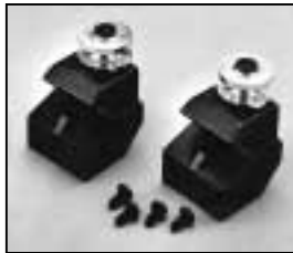
L4.83023.E Accessory bracket p.o. Halteklaupe p.o.