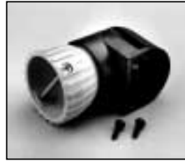
L4.83031.E Focus drive assembled Fokusantrieb montiert