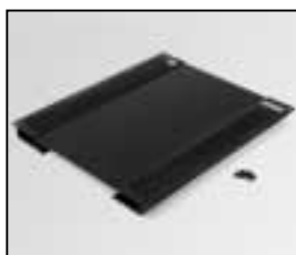
L4.83075.E Set of bottom panels Boden komplett