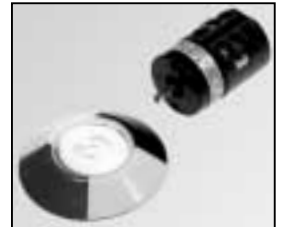
L4.83181.E Switch 4-Pin Schalter 4-Pin