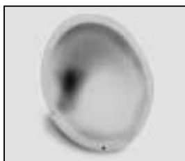
L4.83006.E Reflector Reflektor