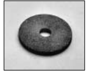
L4.83153.E Friction disc Frictionsscheibe