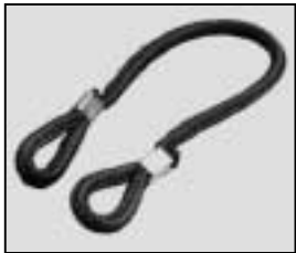
L4.79855.E Cable tie Halteleine