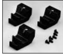
L4.83014.E Accessory bracket man. Halteklauwe man.