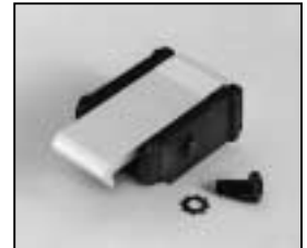
L4.79747.E Door catch set Schnapphaken Set