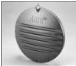
L4.83041.E Rear casting Rückteil