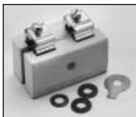
L4.83008.E Lampholder complete Lampenfassung komplett