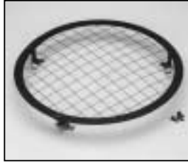
L4.83011.E Wire guard complete Schutzgitter komplett