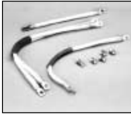
L4.83049.E Internal cable set 100-240 V man. Kabel-Set innen 100-240 V man.