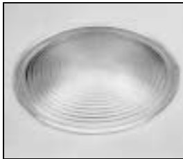
L4.83156.E Fresnel lens Stufenlinse