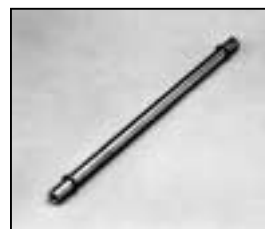
L4.83012.E Guide rail Leitspindel