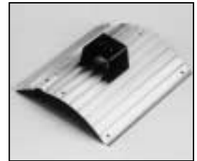
L4.83150.E Side extrusion compl./left Rippenblech kpl./links