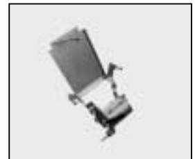
L4.83043.E Lampholder + lamp carriage Lampenfassung + Fokusschlitten