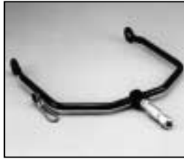
L4.83020.E Stirrup man. Haltebügel man.