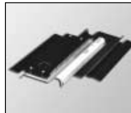
L4.83044.E Internal side baffles left + right Mantelstrombleche links + rechts