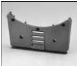
L4.83042.E Base casting front and rear Wannenstirnteil