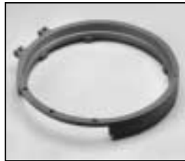
L4.83158.E Front casting Frontteil