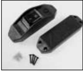
L4.77157.E Inline switch complete 220-240 V Schnurschalter komplett