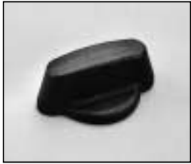
L4.81380.E Focus knob Fokusknopf