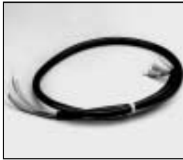
L4.83514.E Head to switch cable 200-240 V man. Zuleitung 200-240 V man.