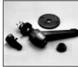
L4.83021.E Stirrup mounting set Bügelbefestigungs-Set