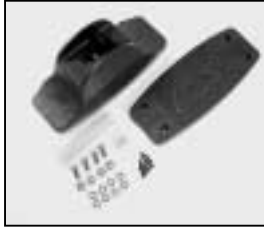
L4.82846.E Inline switch complete 110-120 V Schnurschalter komplett