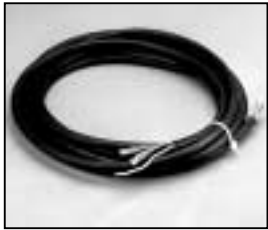
L4.83512.E Mains cable 200-240 V man. Netzkabel 200-240 V man.