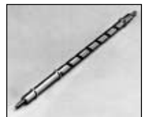
L4.83017.E Focus spindle Fokusspindel