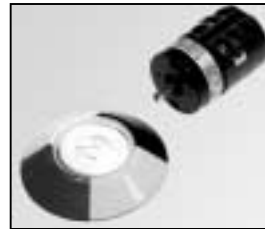
L4.83181.E Switch 4-Pin Schalter 4-Pin