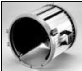
L4.83040.E Housing compl. Gehäuse kpl.

NOTE: WHEN ORDERING QUOTE PART NUMBER BEMERKUNG: BEI BESTELLUNG IDENT.-NR. ANGEBEN