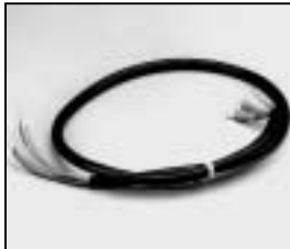
L4.83514.E Head to switch cable 200-240 V man. Zuleitung 200-240 V man.