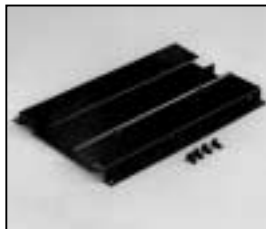
L4.83009.E Set of bottom panels Boden komplett