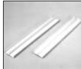
L4.83053.E Extrusions, top Rippenbleche oben