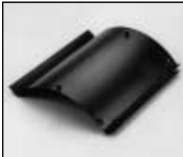
L4.83159.E Internal side baffle right Mantelstromblech rechts