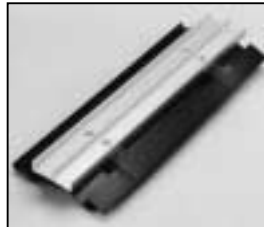
L4.83038.E Top cover Abdeckung oben