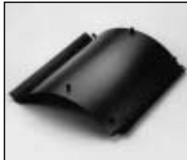
L4.83160.E Internal side baffle left Mantelstromblech links