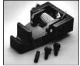
L4.83015.E Top latch man. Torsicherung man.