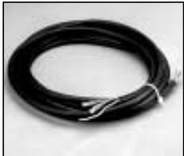
L4.83512.E Mains cable 200-240 V man. Netzkabel 200-240 V man.