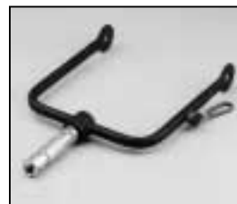
L4.73853.E Stirrups man. Haltebügel man.