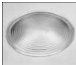
L4.79572.E Fresnel lens Stufenlinse