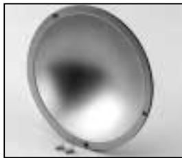
L4.79743.E Reflector Reflektor