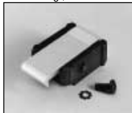
L4.79747.E Door catch set Schnapphaken-Set