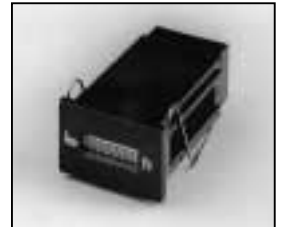
L4.77678.E Hour counter elec. 20/100 Hz from ser. no. 734/94 Betriebsstundenzähler elektr. 20/100 Hz ab Ser. Nr. 734/94