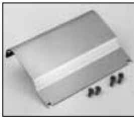
L4.73845.E Internal side baffle right from ser. no. 734/94 Mantelstromblech rechts ab Ser. Nr. 734/94