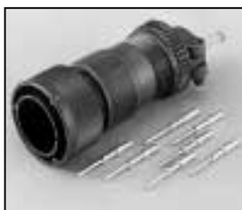
L4.71874.E Veam connector (Male) Veam Stecker (Stiftkontakt)