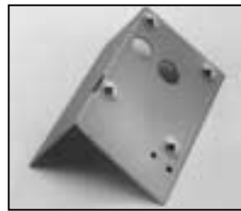
L4.73944.E Intermediate panel from ser. no. 734/94 Zwischenblech ab Ser. Nr. 734/94