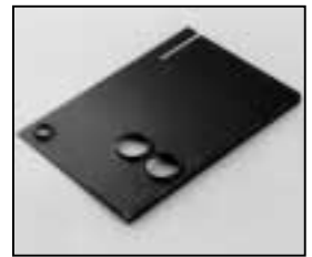
L4.73864.E Cover Abdeckblech