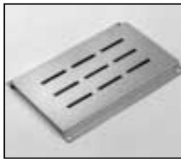
L4.73987.E Bottom panel from ser. no. 734/94 Bodenblech ab Ser. Nr. 734/94