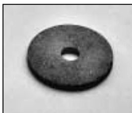
L4.83153.E Friction disc Friktionssscheibe