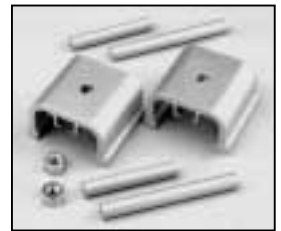
L4.74388.E from ser. no. 1759/ab Ser. Nr. 1759 Stirrup bracket Büggelager