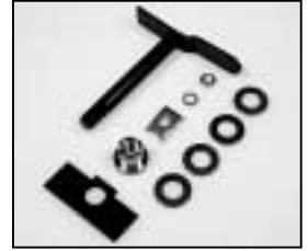
L4.73817.E Lamp lock shaft Hebel geschweißt