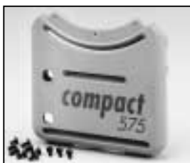
L4.73942.E Base casting, front from ser. no. 734/94 Wannenstirnenteil, vorne ab Ser.Nr. 734/94