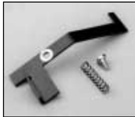
L4.73848.E Safety switch activator Klinke für Endschalter