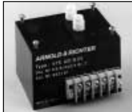
L4.73834.E Ignitor Zündgerät