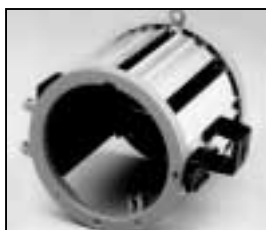
L4.73785.E to ser. no. 1758 / bis Ser. Nr. 1758 L4.79686.E from ser. no. 1759/ab Ser. Nr. 1759 Housing compl. / Gehäuse kpl.

NOTE: WHEN ORDERING QUOTE PART NUMBER BEMERKUNG: BEI BESTELLUNG IDENT.-NR. ANGEBEN