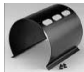
L4.73789.E to ser. no. 1758 / bis Ser. Nr. 1758 L4.79622.E from ser. no. 1759/ab Ser. Nr. 1759 Internal side baffle/Mantelstromblech