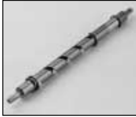
L4.73839.E Focus spindle man. Fokusspindel man.