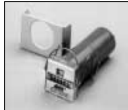
L4.73448.E Hour counter elec. 50/60 Hz to ser. no. 733/94 Betriebsstundenzähler elektr. 50/60 Hz bis Ser. Nr. 733/94