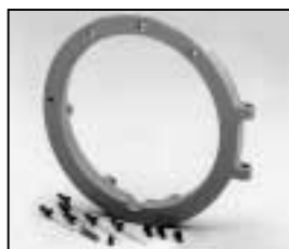
L4.73786.E to ser. no. 1758 / bis Ser. Nr. 1758 L4.79687.E from ser. no. 1759/ab Ser. Nr. 1759 Front casting / Frontteil