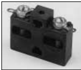
L4.75787.E Spark gap Funkenstrecke