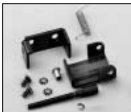
L4.73796.E Top latch man. Torsicherung man.