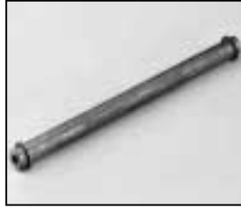
L4.73840.E Guide rail Leitspindel