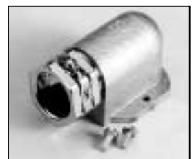
L4.73474.E Screw-type conduit fitting to ser. no. 2481/bis Ser. Nr. 2481 Kabelverschraubung L4.73617.E Screw-type conduit fitting new from ser. no. 2482/ab Ser. Nr. 2482 Kabelverschraubung neu