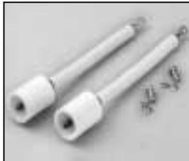
L4.73445.E H.T. cables complete Lampenkabel komplett