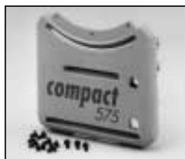
L4.73943.E Base casting, rear from ser. no. 734/94 Wannenstirnenteil, hinten ab Ser.Nr. 734/94