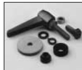
L4.73776.E to ser. no. 1758 / bis Ser. Nr. 1758 L4.79273.E from ser. no. 1759/ab Ser. Nr. 1759 Stirrups mounting set man./Bügelbefestigungs-Set man.