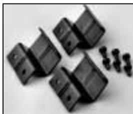
L4.79744.E Accessory bracket man. Halteklauwe man.