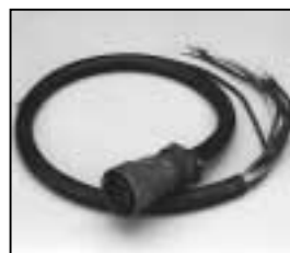
L4.73781.E Mains cable (Veam) Scheinwerferkabel (Veam)