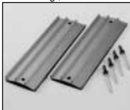
L4.73788.E to ser. no. 1758 / bis Ser. Nr. 1758 Extrusions, top Rippenbleche oben