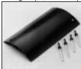
L4.73790.E to ser. no. 1758 / bis Ser. Nr. 1758 Top cover Abdeckung oben