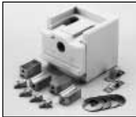
L4.73824.E Lamp holder complete Lampenfassung komplett