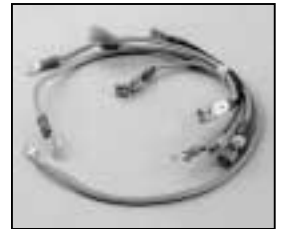
L4.73480.E Connecting wire Verbindungslitzen