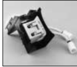
L4.73859.E Lamp holder + lamp carriage Lampenfassung + Fokusschlitten