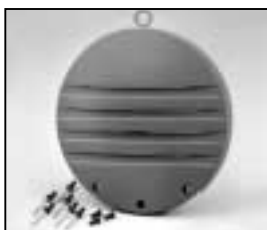
L4.73787.E to ser. no. 1758 / bis Ser. Nr. 1758 L4.79688.E from ser. no. 1759/ab Ser. Nr. 1759 Rear casting / Rückteil