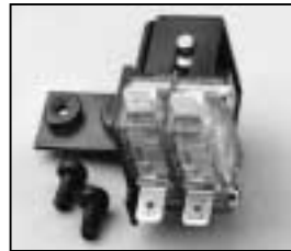
L4.73851.E Safety switch complete Endschalter komplett