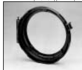
L4.79573.E Lens door Linsenfassung