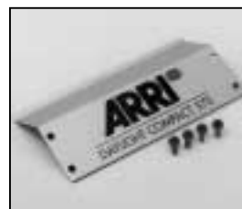
L4.73838.E Side panel left or right Seitenblech links oder rechts