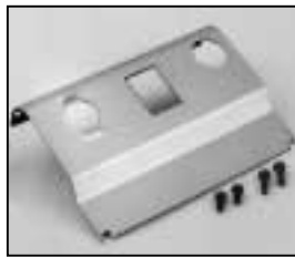
L4.73989.E Internal side baffle left from ser. no. 734/94 Mantelstromblech links ab Ser. Nr. 734/94