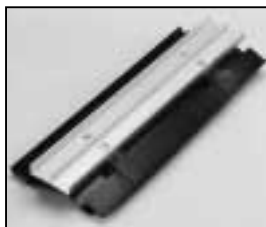
L4.83038.E Top cover Abdeckung oben