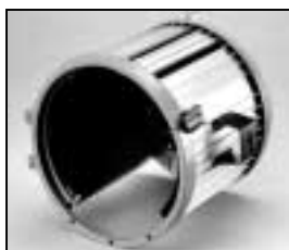
L4.83040.E Housing compl. Gehäuse kpl.

NOTE: WHEN ORDERING QUOTE PART NUMBER BEMERKUNG: BEI BESTELLUNG IDENT.-NR. ANGEBEN