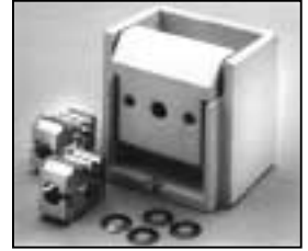
L4.73533.E Lampholder complete Lampenfassung komplett