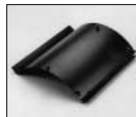
L4.83159.E / L4.83160.E Internal side baffle right/left Mantelstromblech rechts/links