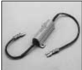
L4.73455.E Compensating resistance for electronic hour counter Vorwiderstand kpl. für elektr. Betriebsstundenzähler