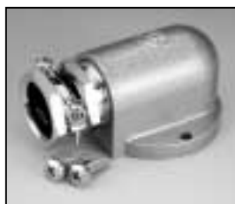
L4.73627.E from ser. no. 2851 Screw-type conduit fitting ab Ser. Nr. 2851 Kabelverschraubung