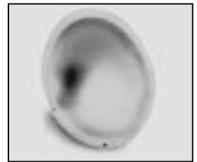
L4.83006.E Reflector Reflektor