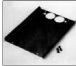
L4.73682.E Cover Abdeckblech