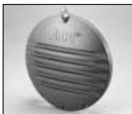
L4.83041.E Rear casting Rückteil