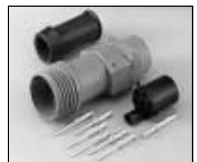
L4.75624.E Schaltbau connector with traction relief Schaltbau Stecker mit Zugentlastung