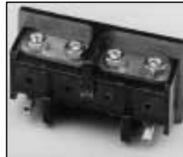
L4.75789.E Spark gap Funkenstrecke