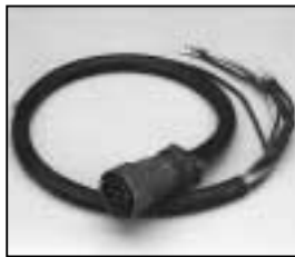
L4.73538.E Mains cable (Veam) Scheinwerferkabel (Veam)