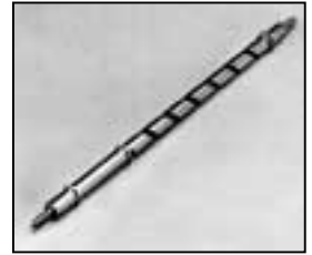
L4.83017.E Focus spindle man. Fokusspindel man.