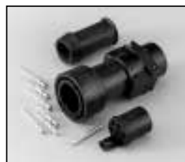
L4.75622.E Schaltbau connector (Male) Schaltbau Stecker (Stiftkontakt)