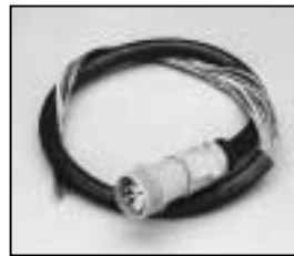
L4.73539.E Mains cable (Schaltbau) Scheinwerferkabel (Schaltbau)