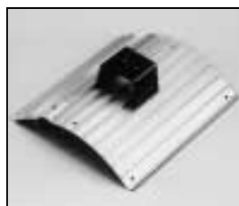
L4.83149.E / L4.83150.E Side extrusion compl. right/left Rippenblech kpl. rechts/links