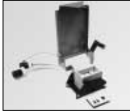
L4.73715.E Lampholder + lamp carriage Lampenfassung + Fokusschlitten