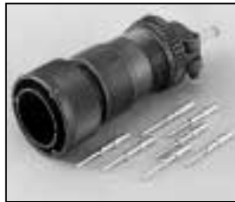
L4.75616.E Veam connector (Male) Veam Stecker (Stiftkontakt)