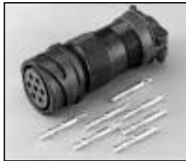
L4.75617.E Veam connector (Female) Veam Stecker (Buchsenkontakt)