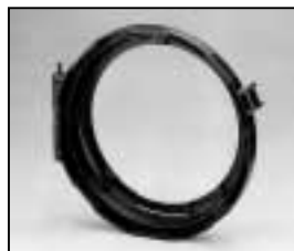
L4.83157.E Lens door Linsenfassung