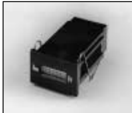
L4.77678.E Hour counter from ser. no. 915/94 Betriebsstundenzähler ab Ser. Nr. 915/94