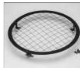
L4.83011.E Wire guard complete Schutzgitter komplett