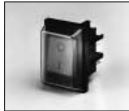
L4.72826.E On/Off switch Wippschalter