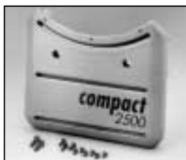
L4.73676.E Base casting, front Wannenstirnteil, vorne