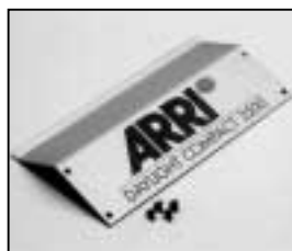
L4.73678.E Side panel left or right Seitenblech links oder rechts