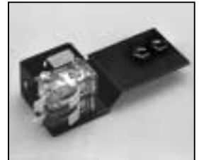
L4.73417.E Safety switch complete Endschalter komplett