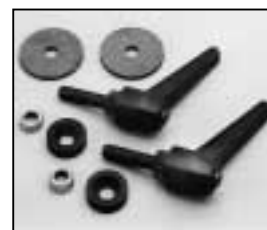
L4.73746.E Stirrup mounting set man. Bügelbefestigungs-Set man.