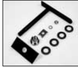
L4.73540.E Lamp lock shaft Hebel geschweißt