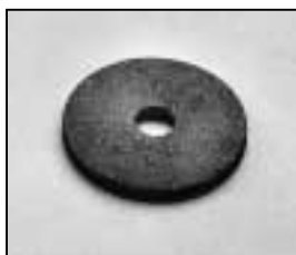
L4.83153.E Friction disc Friktionsscheibe