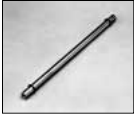
L4.83012.E Guide rail Leitspindel