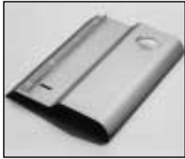
L4.73695.E Internal side baffle left Mantelstromblech links