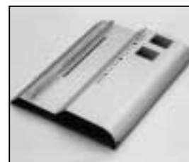
L4.73768.E Internal side baffle right from ser. no. 915/94 Mantelstromblech rechts ab Ser. Nr. 915/94