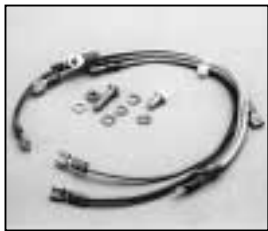
L4.73660.E Connecting wire Verbindungsleitungen