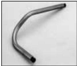
L4.73700.E Safety switch activator Drahtauslöser