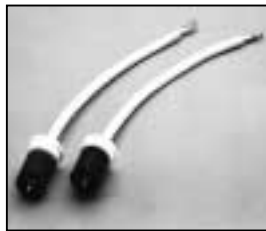
L4.73640.E H.T. cables complete Lampenkabel komplett