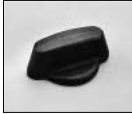
L4.81380.E Focus knob Fokusknopf