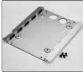
L4.73685.E Intermediate panel Zwischenblech