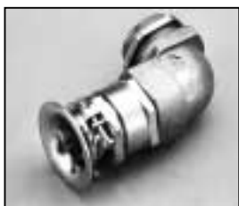
L4.73549.E to ser. no. 2850 Screw-type conduit fitting bis Ser. Nr. 2850 Kabelverschraubung