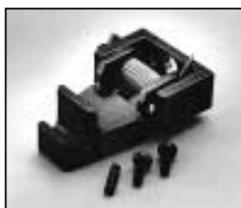
L4.83015.E Top latch man. Torsicherung man.