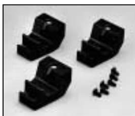
L4.83014.E Accessory bracket man. Halteklauwe man.