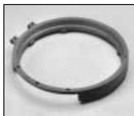
L4.83158.E Front casting Frontteil