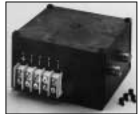
L4.73645.E Ignitor Zündgerät