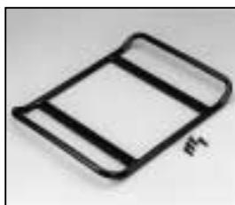
L4.73684.E Base skid Kufe