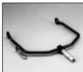
L4.77390.E Stirrup man. Haltebügel man.